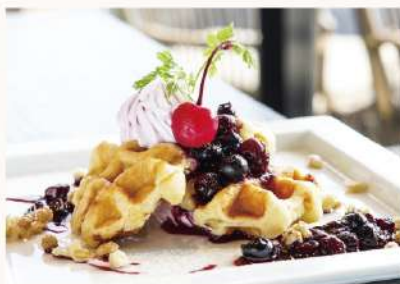
ベリーベリーワッフル Very Berry Waffle