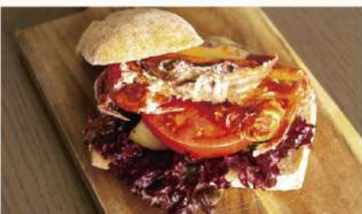
丸ごとソフトシェルクラブサンド 1750 Soft Shell Crab Sandwiches