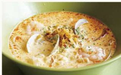
絶品シーフードラクサ 1650 濃厚海老ココナッツスープのライスヌードル Seafood Laksa