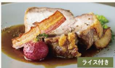
三元豚のローストポーク 200g 1750 フルーツBBQソース Roasted Pork