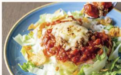
メカジキとイカの 1550 シーフードタコライス Seafood Taco Rice