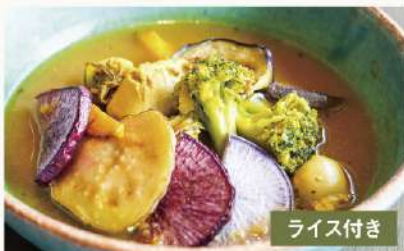
牡蠣と具沢山三浦野菜の 1750 スープカレー Oyster & Vegetables Soup Curry