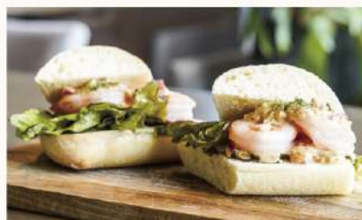
ガーリックシュリンプの 1750 サンドウィッチ Garlic Shrimp Sandwiches