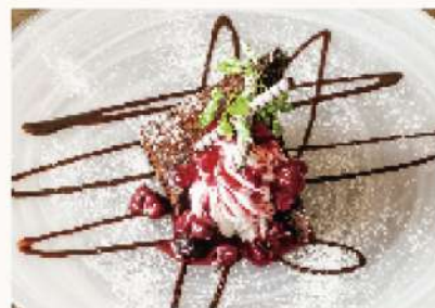
クラシックガトーショコラ Gateau chocolat