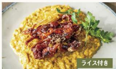
丸ごとソフトシェルクラブの 2450 プーパッポンカレー Soft Shell Crab Poo Pad Pong Curry