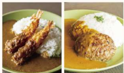
お子様カレー Kid's Curry 650