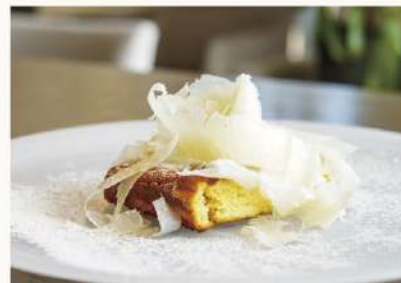
削りたてラスパドゥーラチーズの Wチーズケーキ W Cheese Cake