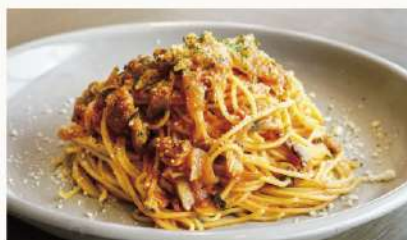
魚介のアマトリチャーナ 1750 Seafood Amatriciana