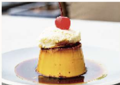
濃厚レトロプリン Retro Pudding