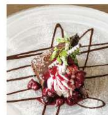
クラシック ガトーショコラ Gateau chocolat