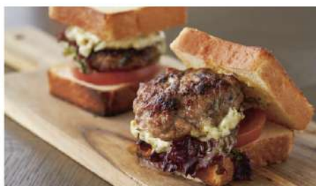
鰯オッシュュサンド Yellowtail Brioche Sandwiches