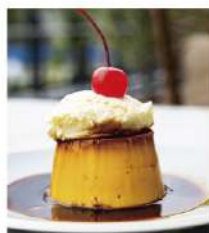
濃厚 レトロプリン Retro Pudding