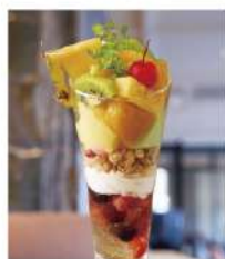
トロピカル パフェ Tropical Parfait