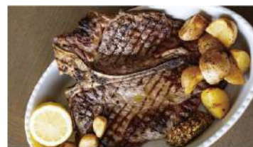
骨付き豪快! Tボーンステーキ