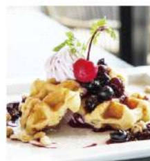
ベリーベリー ワッフル Very Berry Waffle