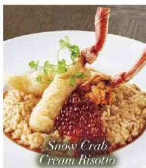
Snow Crab Cream Risotto