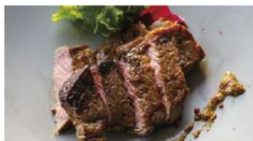
US産サーロインステーキ 粒マスタードソース Beef Sirloin Steak, Mustard Sauce