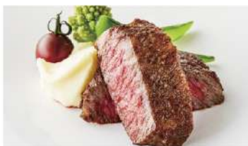
和牛のグリル Grilled Japanese Wagyu Beef