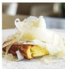
削りたて ラスバドゥーラチーズの Wチーズケーキ W Cheese Cake