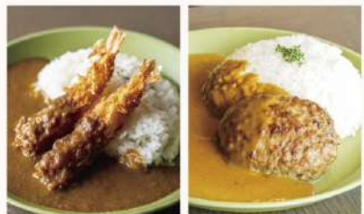
お子様カレー Kid's Curry 700