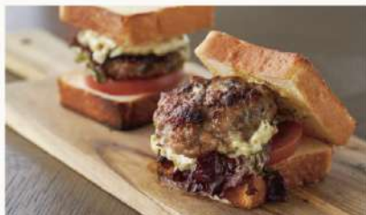
鯛オッシュュサンド 2000 Yellowtail Brioche Sandwiches