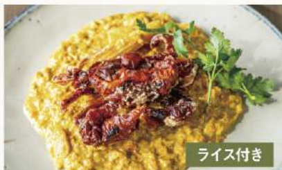
丸ごとソフトシェルクラブの 2580 プーパッポンカレー Soft Shell Crab Poo Pad Pong Curry