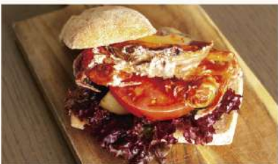
丸ごとソフトシェルクラブサンド 1840 Soft Shell Crab Sandwiches