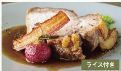
三元豚のローストポーク 200g 1840 フルーツBBQソース Roasted Pork