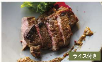
US産サーロイン 3780 ステーキ 200g Beef Sirloin Steak