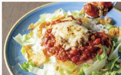
メカジキとイカの 1630 シーフードタコライス Seafood Taco Rice