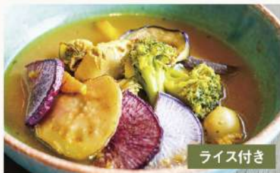
牡蠣と具沢山三浦野菜の 1840 スープカレー Oyster & Vegetables Soup Curry