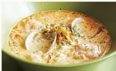
絶品シーフードラクサ 1740 濃厚海老ココナッツスープのライスヌードル Seafood Laksa